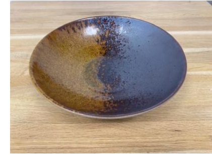
MA EL AC / APA