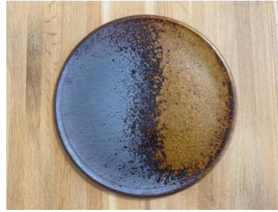
DU EL AP PM / GM

Ass Plate Eclipse D 18 cm / 24,5 cm H 1,5cm