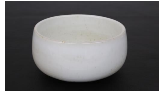
KO IV B25