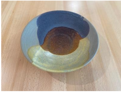
MA GC AC/APA

Ass Creuse Graphite/Cuivre D19/24cm H5,5cm