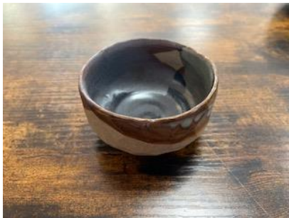
RE GO BPM