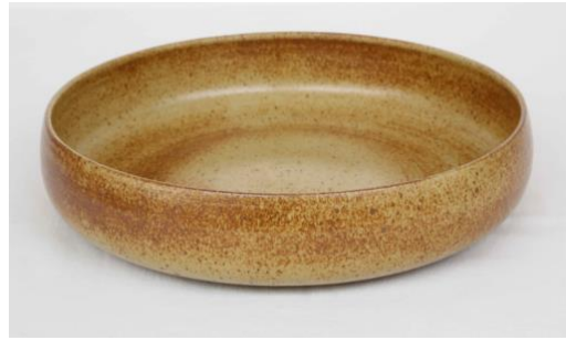
KO RU PCM / KO RU PC