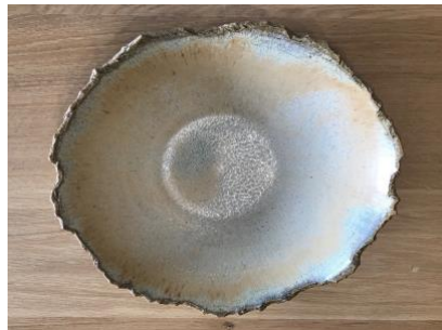
FR OP ACGM