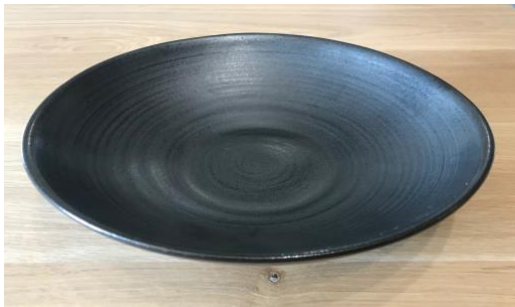
MA AN AC / MA AN APA