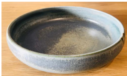
KO NPB PCM / KO NPB PC