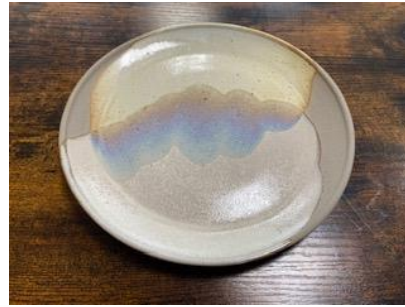
KO SN AD/AP

Ass Plate Graphite/Cuivre D20 ou D 25 cm