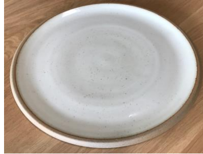
DU IV AP PM / GM

Ass Ultra Plate Bleu Baltique D 24 / 30 cm