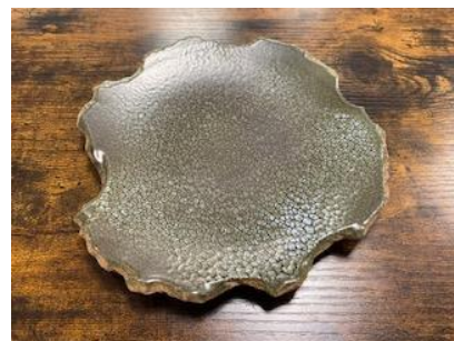
FR LU AP/AD