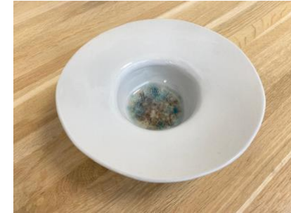
CAPELLO – SEA GLAZED