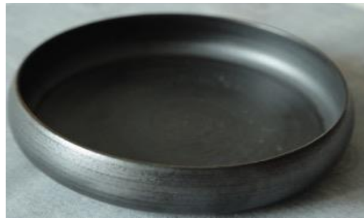
KO AN PCM / KO AN PC