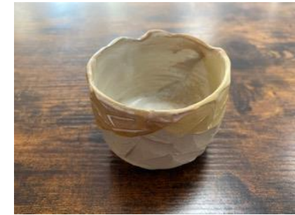
RE ON GGM