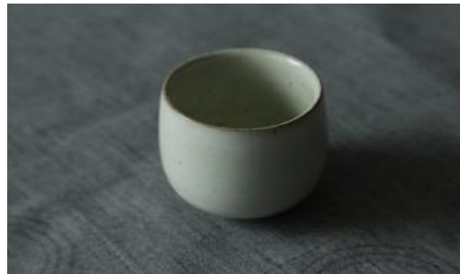
KO IV G10/ KO IV G25