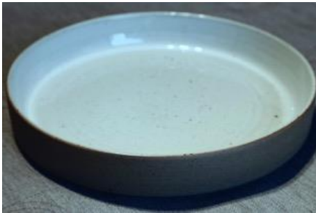
BA IV AC GM