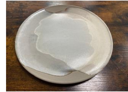
KO BN AD/AP