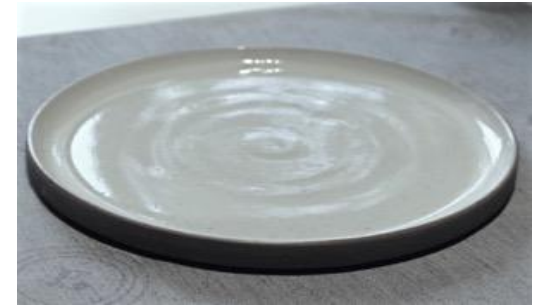
GPIVPL0 / GPIVPL1 / GPIVPL2