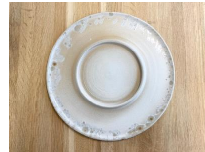
SATURNO - MOON