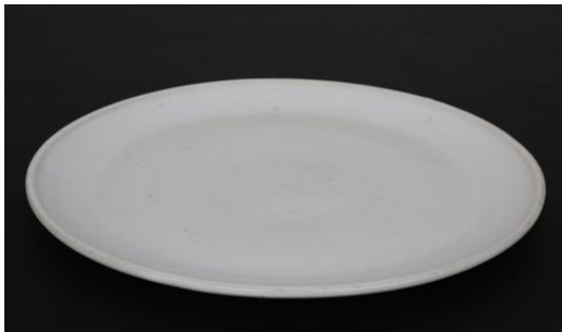
KO IV AP