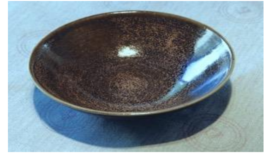
MA KS AC / MA KS APA