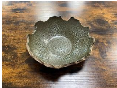
FR LU CO