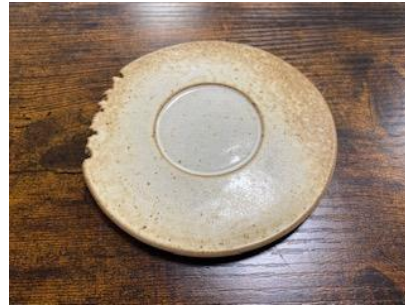
CA SI SOPM/SOMM