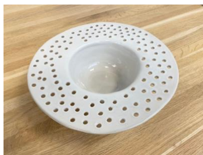
CAPELLO - PITTED