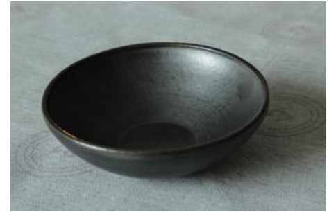
KO AN CO Coupelle Noire D 14cm H 4,5cm