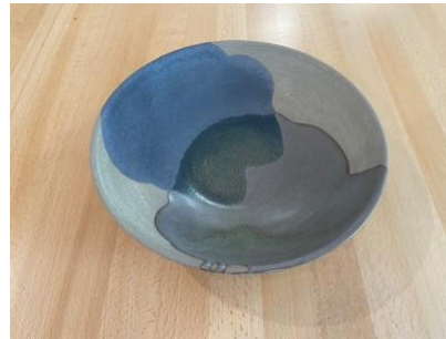
MA GO AC/APA

Ass Creuse Graphit/Opaline D19/24cm H5,5cm