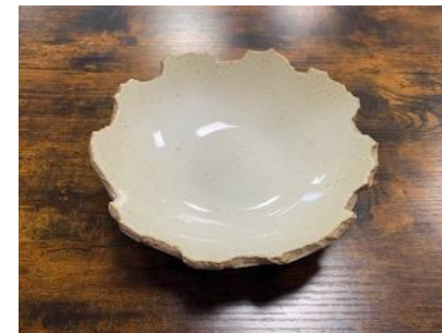
FR IV ACGM