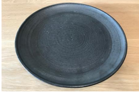
KO AN AP Assiette Plate D 25cm