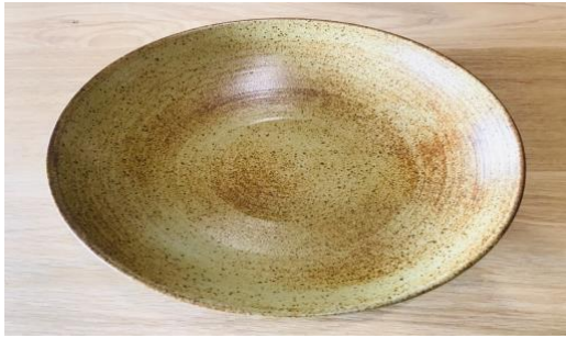
MA RU AC / MA RU APA