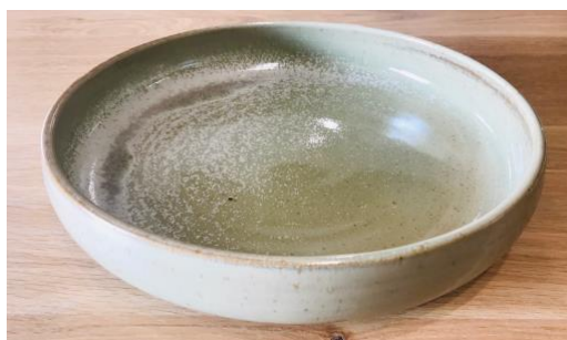
KO NVG PCM / KO NVG PC