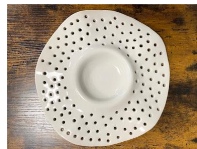
MANTA WAVES - PITTED