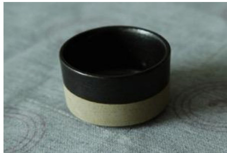
BA AN B7/BA AN B15