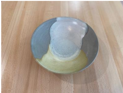
MA ON AC/APA

Ass Creuse Brume/Naturel D19/24cm H5,5cm