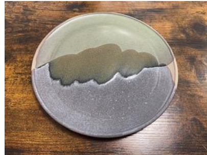
KO GO AD/AP

Ass Plate Graphit/Opaline D20 ou D 25 cm