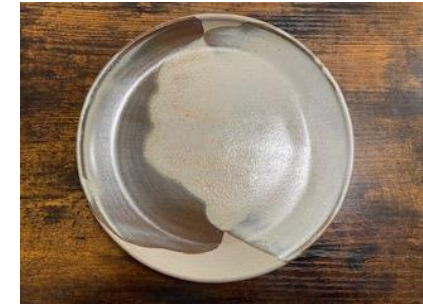
KO BB AD/AP

Ass Plate Graphit/Opaline D20 ou D 25 cm