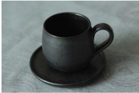
KO AN TM / KO AN SC Tasse et Sous-Tasse à Café Noire