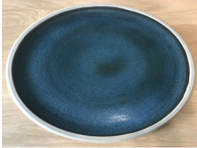
DU BB AP PM / GM

Ass Ultra Plate Bleu Baltique D 24 / 30 cm