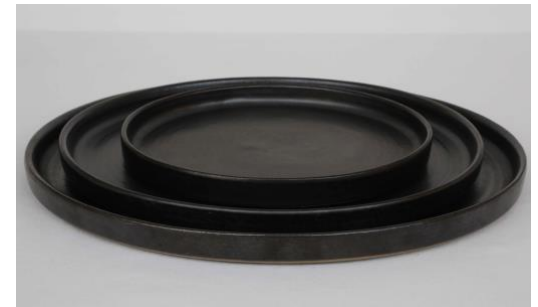
GPANPL0 / GPANPL1 / GPANPL2