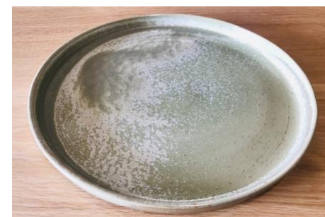
GPNVGPL0 / GPNVGPL1 / GPNVGPL2

Ass Plate Reb Verte D 17/23/27cm H 1,8cm