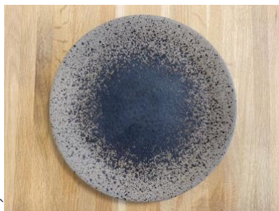
MA SP AN AD / AP