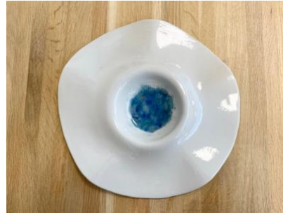
MANTA WAVES – SEA GLAZED