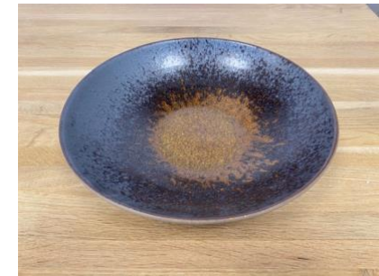
MA ES AC / APA