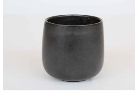
KO AN G10/ KO AN G25 Gobelet Noir 10 ou 25 cl