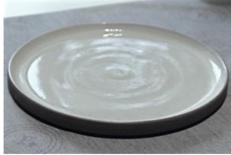
BA IV AP