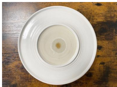
SATURNO - SINGLE POIS