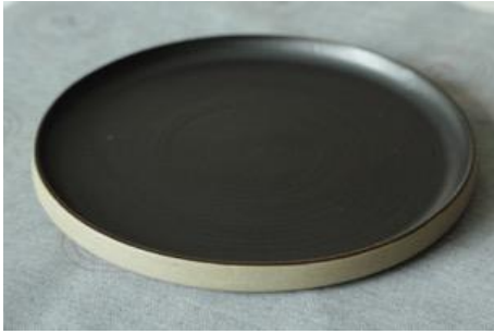
BA AN AD