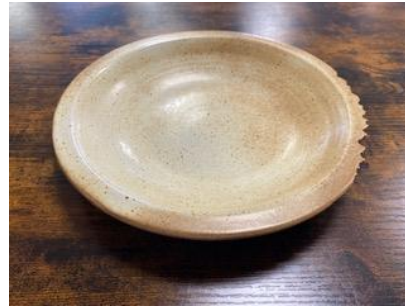
CA SI AC