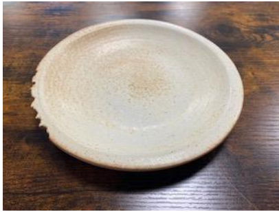
CA SI AP/AD