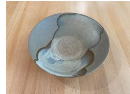
MA BB AC/APA

Ass Creuse Graphit/Opaline D19/24cm H5,5cm