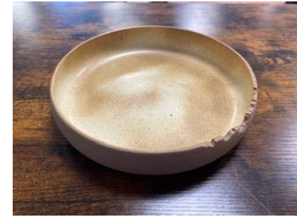
CA SI PC/PCM