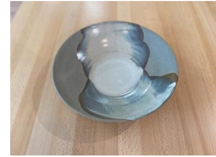
MA BN AC/APA

Ass Creuse Sisal/Naturel D19/24cm H5,5cm