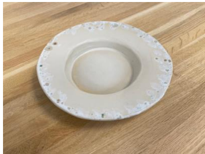
CAPELLO TULLIO - MOON