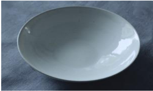
MA IV AC / MA IV APA