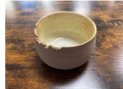
CA SI BPM/BMM/BGM

Bol Canopée Petit – Moyen – Grand Modèle