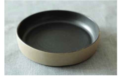
BA AN AC