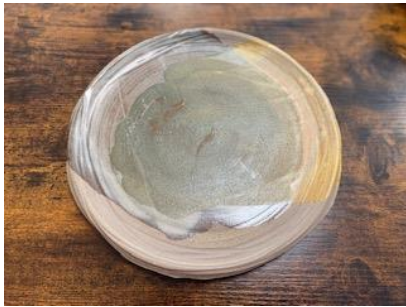
RE ON APPM / APM