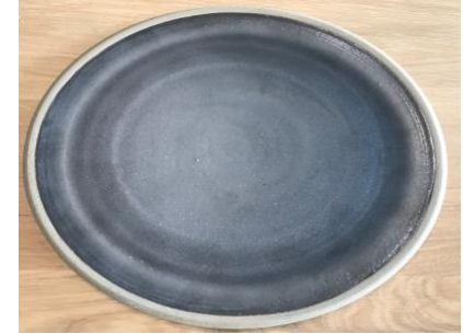
DU AN AP PM / GM