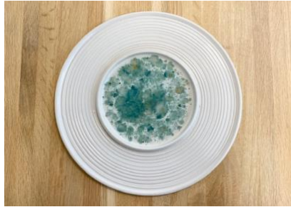
SATURNO – SEA GLAZED