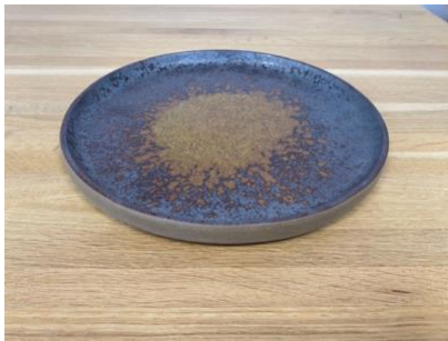
BA ES AD / AP

Ass Plate Eclipse D 18 cm / 24,5 cm H 1,5cm