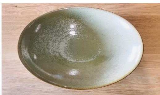
MA NVG AC / MA NVG APA