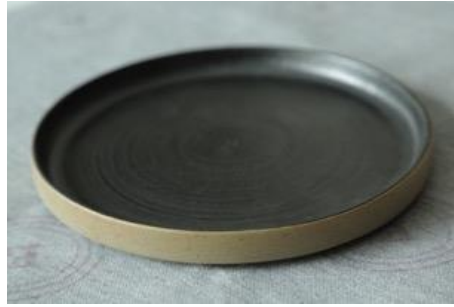
BA AN AP