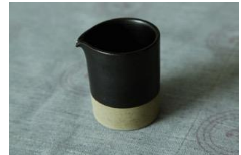
BA AN CR