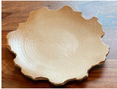
FR SI AP/AD