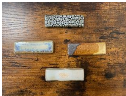
PCT - Porte-Couteau D 7 x 2,3 cm