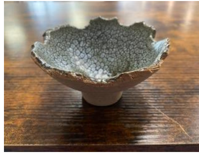
FR LU BMM/BPM