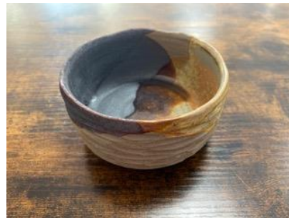
RE GC BMM