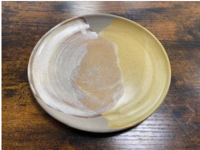
KO ON AD/AP