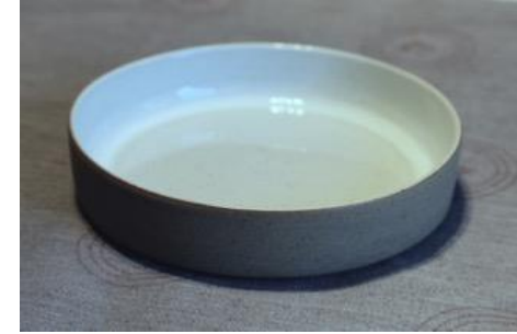
BA IV AC