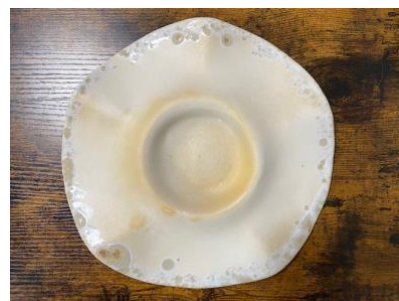
MANTA WAVES - MOON