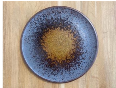
DU ES AP PM / GM

Ass Plate Eclipse D 18 cm / 24,5 cm H 1,5cm