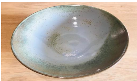
MA NPB AC / MA NPB APA