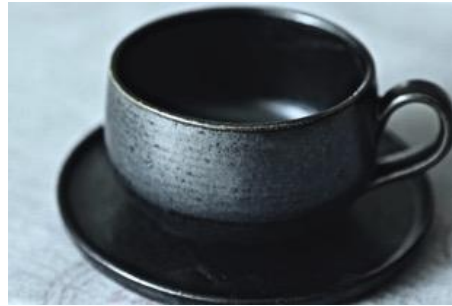
KO AN TT / KO AN ST Tasse et Sous-Tasse à Thé Noire