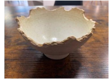
FR SI BMM/BPM