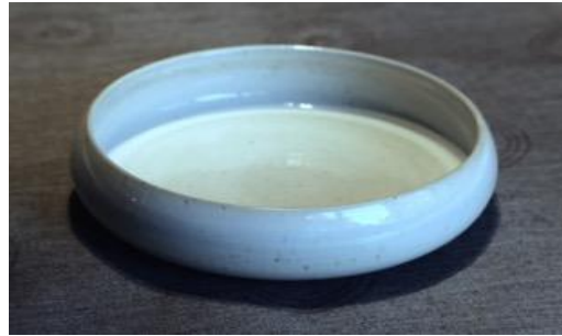
KO IV PCM / KO IV PC