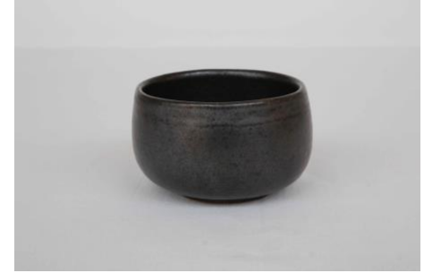
KO AN B25 Bol Noir 25 cl