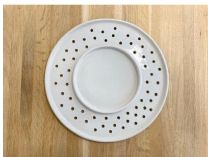
SATURNO - PITTED