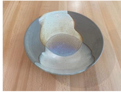
MA SN AC/APA

Ass Creuse Graphite/Cuivre D19/24cm H5,5cm