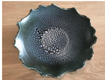
FR LU ACGM