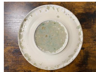
SATURNO - MOON GLAZED INSIDE