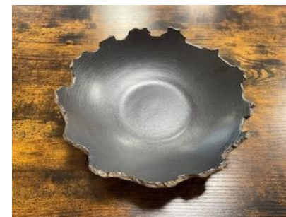
FR AN ACGM