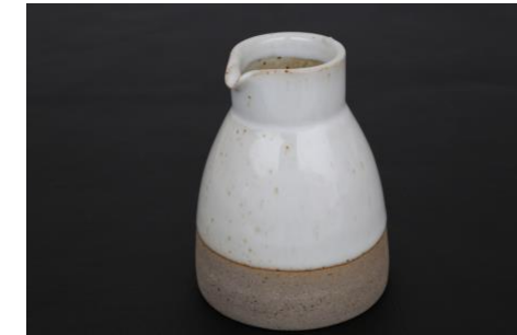
MA IV CR10