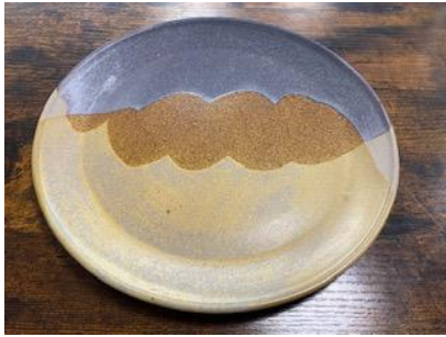
KO GC AD/AP

Ass Plate Graphite/Cuivre D20 ou D 25 cm