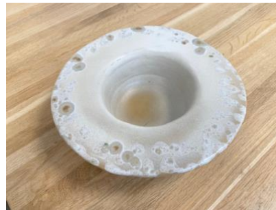
CAPELLO - MOON