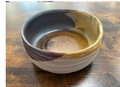
RE GC BGM