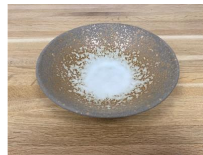
MA SP IV AC / APA