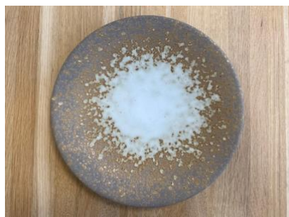
MA SP IV AD / AP