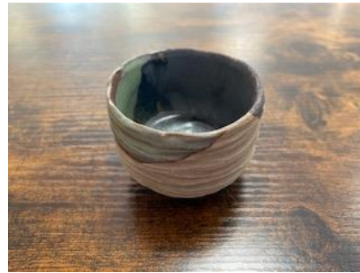
RE GO GPM