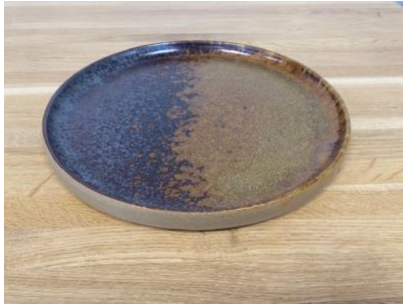
BA EL AD / AP

Ass Plate Eclipse D 18 cm / 24,5 cm H 1,5cm