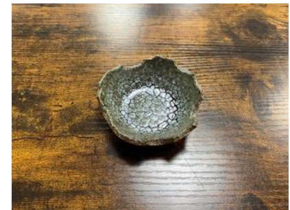
FR LU MC