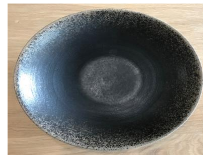
MA SP AN AC / APA