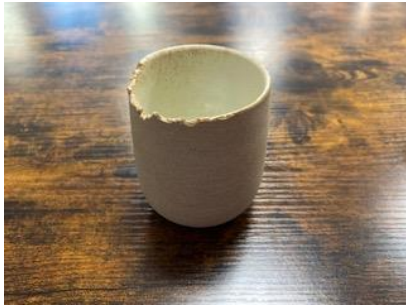
CA SI G10/25