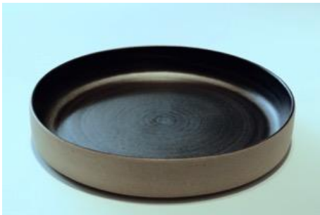
BA AN AC GM