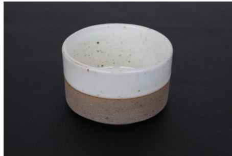
BA IV B7 / BA IV B15