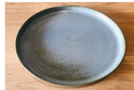
GPNPBPL0 / GPNPBPL1 / GPNPBPL2